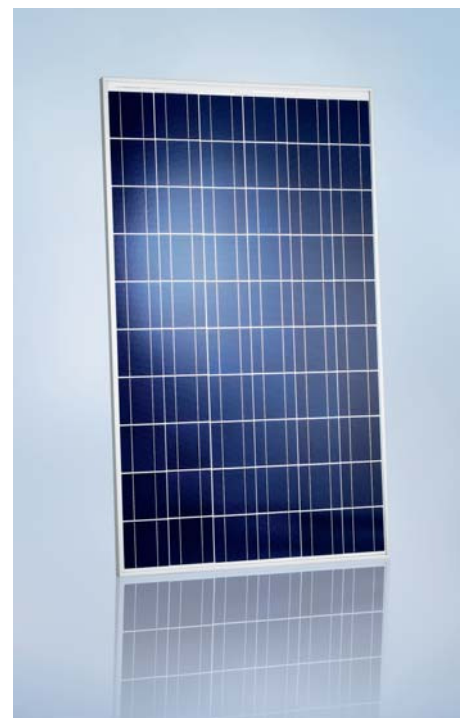
SCHOTT POLY™ 195/202/210